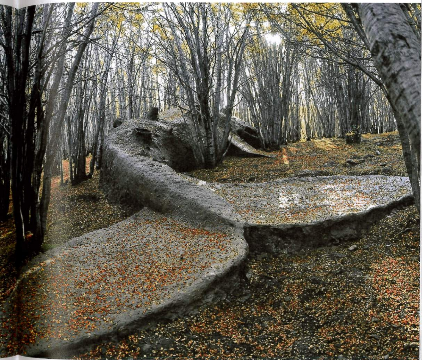
ADRIÁN VILLAR ROJAS, MI FAMILIA MUERTA (MY DEAD FAMILY) , 2009, wood, rock, clay, 118 x 1063 x 157 1/2", 2nd End of The World Biennial, Ushuaia, Argentina / MEINE TOTE FAMILIE , Holz, Steine, Ton, 300 x 2700 x 400 cm.