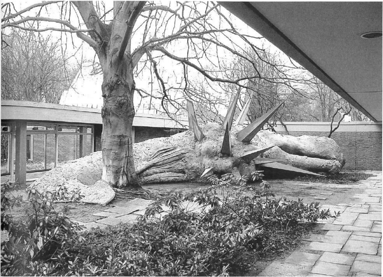
ADRIÁN VILLAR ROJAS, MY DEAD GRANDFATHER , 2010, Akademie der Künste, Berlin / MEIN TOTER GROSSVATER .

sammengesackt, verwest, dunkel. [Pause] Beides steckt in ihm drin – die Drohung und die Ohnmacht des Todes, so verschieden sie auch sind. Und auch Traurigkeit. Ich denke, er sieht so enorm traurig aus, weil überall die abgeschnittenen Äste auf ihm liegen. Wir mögen die Vorstellung von Lebenszyklen, der tote Körper wird wieder zu Erde und lässt die Pflanzen wachsen. Diese «Lebenszyklen» sind eine Art weltliche Erlösung, techno-wissenschaftliche Wiederauferstehung. Hier werden wir auch um diese schwache Hoffnung betrogen – jenem Feigenblatt , mit dem wir das Sterben bedecken. [Pause] Hast du gesagt, dass wir in das Ding hineinschauen können? [CC bestätigt] Dann los, wir wollen sehen, ob der Bildhauer auch die Wurzeln der Baumstümpfe gestaltet hat. Das wäre doch interessant? Setzen wir das Sense-Through-The-Wall-System ein – wir wollen durch die Wände sehen . Vielleicht hat er was Lebendiges verschluckt. [Unhörbar] Schauen wir uns da drin um. Suchen wir in dem armen Wal nach Lebenszeichen. Vielleicht stoßen wir auf einen Jonas. Also los. [Pause] Da haben wir's. Mein Bildschirm ist schwarz! War das jetzt ich oder du? [Pause] Oder der Wal?»