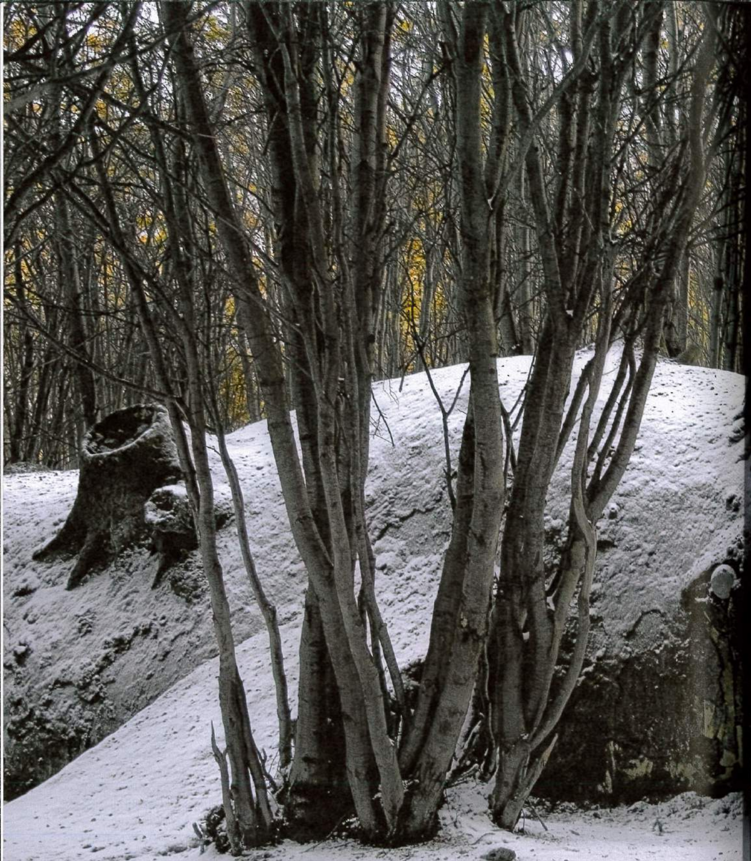
ADRIÁN VILLAR-ROJAS, MI FAMILIA MUERTA (MY DEAD FAMILY) , 2009, wood, rock, clay, 418 x 1063 x 157 1/2", End of The World Biennial , Ushuaia, Argentina / MEINE TOTE FAMILIE , Holz, Stein, Ton, 300 x 2700 x 400 cm.