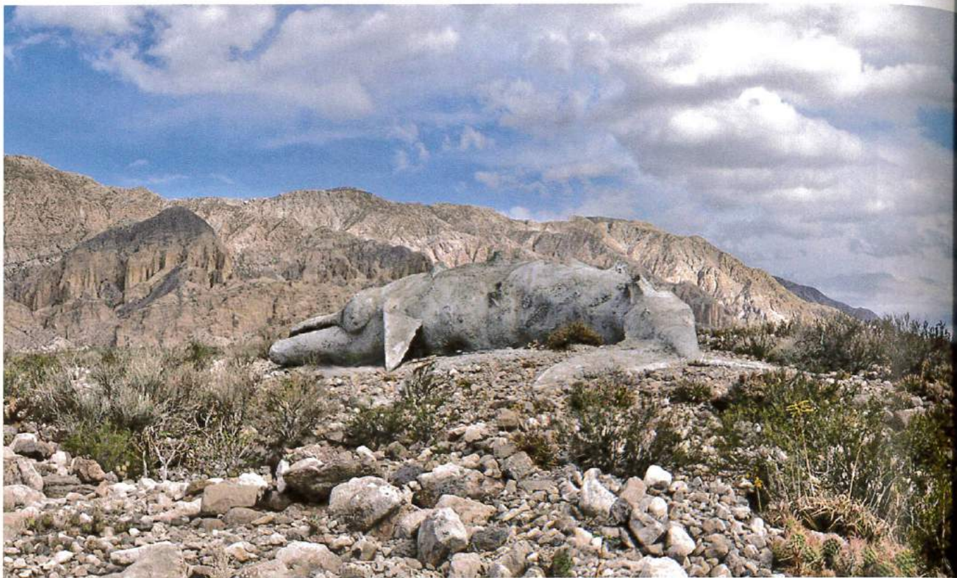
ADRIÁN VILLAR ROJAS, MI FAMILIA MUERTA (MY DEAD FAMILY) 2010, unfired clay, cement, burlap, wood, 118 x 1063 x 157 1 / 2 ”, San Juan, Argentina / MEINE TOTE FAMILIE , ungebrannter Ton, Zement, Jute, Holz, 300 x 2700 x 400 cm.

stellt hohe konzeptuelle Ansprüche. In Fällen wie diesem greifen die üblichen Rezeptions- und Rezensionstools nicht. Der rasch fortschreitende Zerfall des Werks spricht zusätzlich für die Verwendung unkonventioneller Methoden.